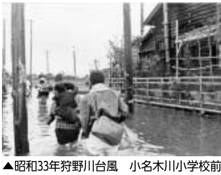
▲昭和33年狩野川台風 小名木川小学校前 ※閉庁日・閉庁時間を除く