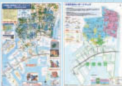
▲江東区大雨浸水ハザードマップ ▲江東区洪水ハザードマップ