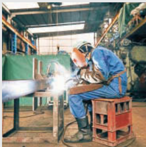
▲火花を飛ばして作業する様子