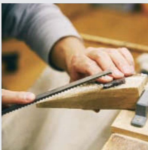
▲希少な「べっ甲」の加工作業