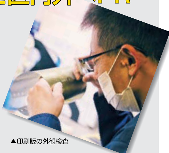
▲印刷版の外観検査