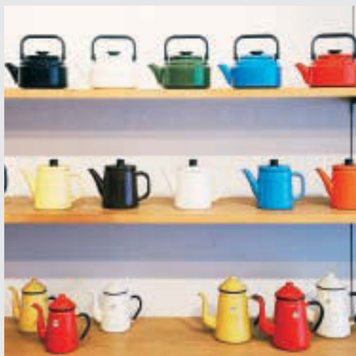
▲色とりどりのホーロー製品