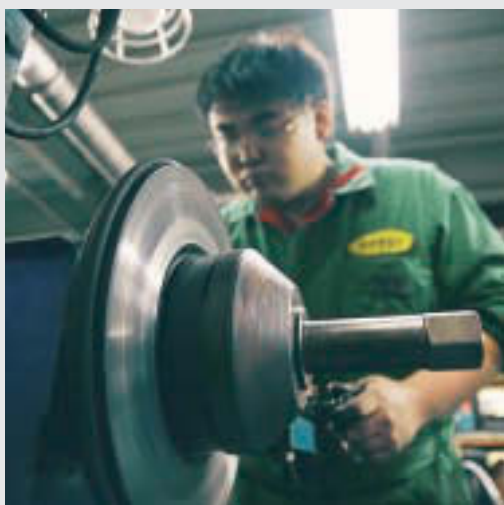
▲ブレーキ用品をメンテナンス