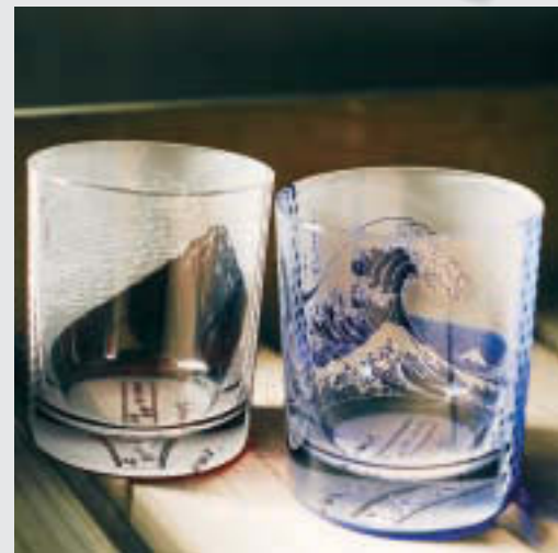
▲世界レベルの繊細さを持つ硝子加工

区では、区内のものづくりの魅力を区内外へ発信するため、新たに江東ブランドの専用ウェブサイトを開設しました。ぜひご覧ください。 ☎ 経済課産業振興係 ☎3647-2332、FAX3647-8442