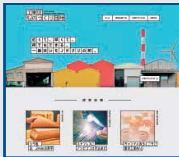
▲ウェブサイト トップページ

また、「江東ブランド」を紹介する冊子を配布しているほか、産業会館(東陽4-5-18)では、認定企業の製品を一部展示しています。 【冊子配布場所】こうとう情報ステーション(区役所2階)、経済課(区役所4階29番)、豊洲特別出張所・各出張所、産業会館