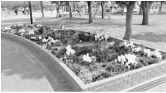
▲豊洲公園のコミュニティガーデン