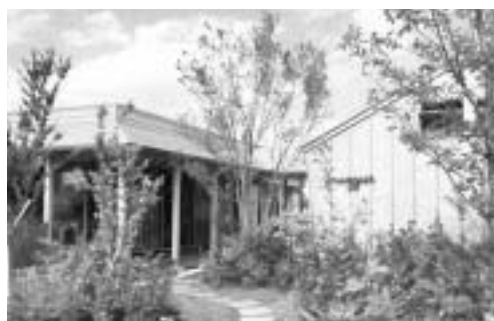
▲マギーズ東京の外観

日本人的2人に1人はがんに罹患します。「がんの疑いがある」「診断を受けた」「治療を始めた」「治療後の生活」などについて、患者さんやご家族の方の不安や疑問に思うことを相談できる窓口を設置します。 仕事等で日中の時間が取れない方でも相談できるように夜間に開設しますので、お気軽にご利用ください。 事業に関する問合せ 保健所健康推進課がん対策・地域医療連携係 ☎(3647)5889 ☎(3615)7171 FAX(3615)7171