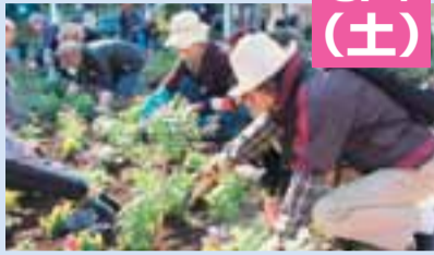
▲花と緑を育て、地域の憩いの場に

区では、区民の皆さんが公園などで花やみどりを育て地域の交流や憩いの場とするコミュニティガーデン活動を実施しています。今回は、コミュニティガーデンによって江東区を花とみどりで笑顔いっぱいにする