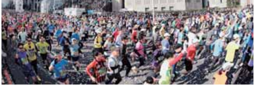
▲スタート地点の様子(昨年の大会)