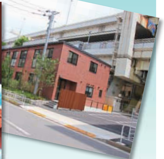
▲ナーサリールームベリーベアー 深川冬木(平成29年4月開設)