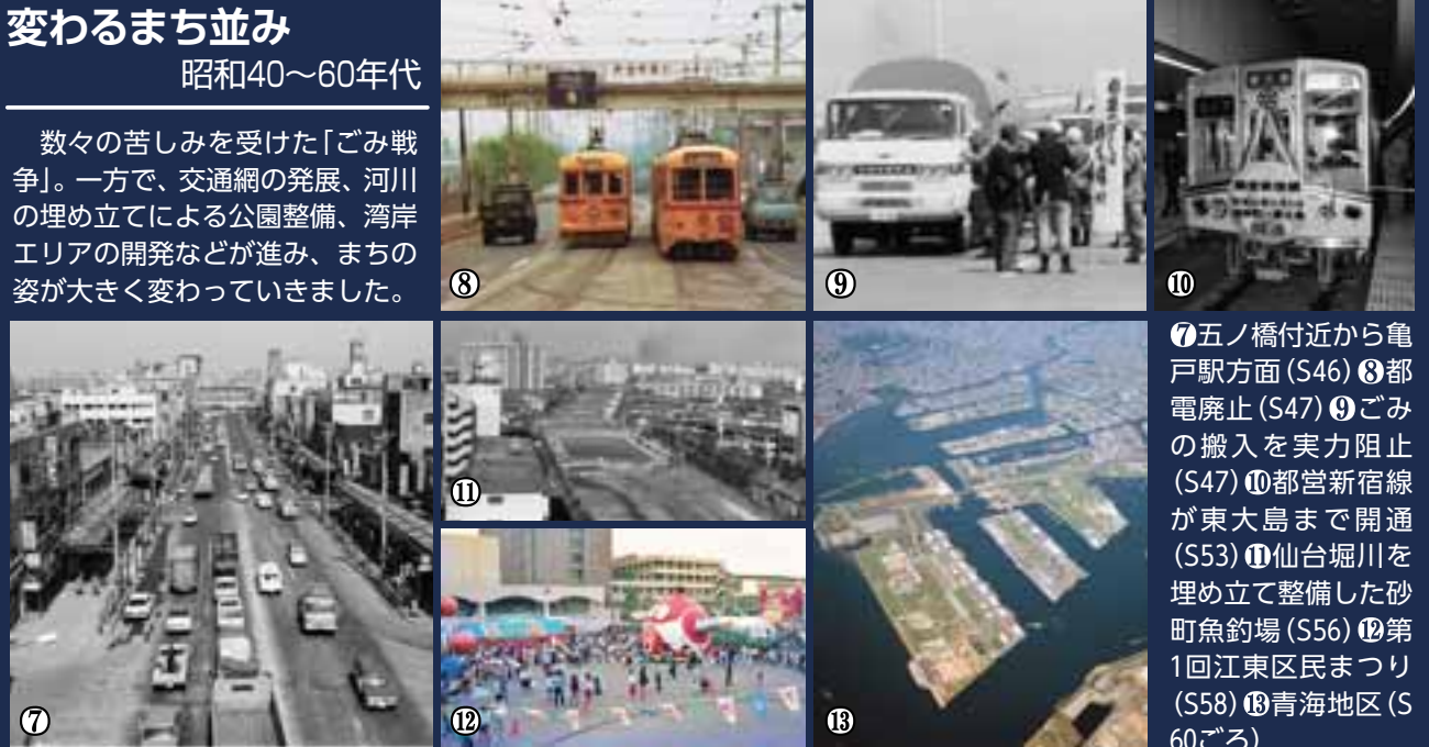
⑦五ノ橋付近から亀戸駅方面(S46) ⑧都電廃止(S47) ⑨ごみの搬入を事実阻止(S47) ⑩都営新宿線が東大島まで開通(S53) ⑪仙台堀川を埋め立て整備した砂町魚釣場(S56) ⑫第1回江東区民まつり(S58) ⑬青海地区(S60ごろ)

数々の苦しみを受けた「ごみ戦争」。一方で、交通網の発展、河川の埋め立てによる公園整備、湾岸エリアの開発などが進み、まちの姿が大きく変わっていきました。