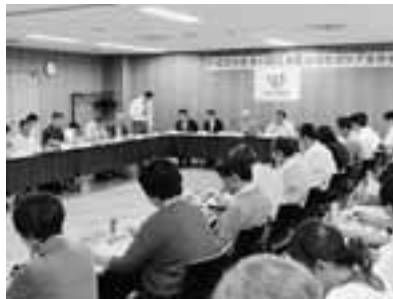
▲江東区地域包括ケア全体会議の様子

また、生活保護制度の適切・適正な運用と、生活保護に至る前の生活困窮者に対する相談窓口を活用するとともに、貧困の連鎖を防止するため、生活保護受給世帯の生徒等に対して実施する学習支援事業などの生活困窮者自立支援事業を充実させていきます。