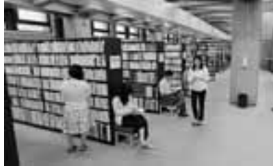
▲月曜開館が試行的に導入される江東図書館

ます。また、区民サービス向上のため、江東図書館において、10月より試行として月2回の月曜開館を実施します。