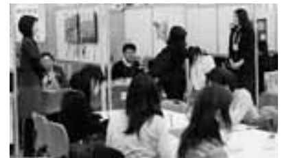
▲2月に初開催された保育園就職フェア

また、認可外保育施設の保護者負担軽減事業において、多子世帯の見直しなど、負担軽減の拡充を図っていきます。