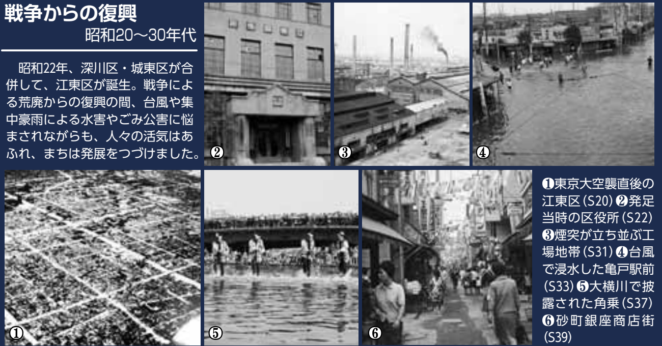
①東京大空襲直後の江東区(S20) ②発足当時の区役所(S22) ③煙突が立ち並ぶ工場地帯(S31) ④台風で浸水した亀戸駅前(S33) ⑤大横川で披露された角乗(S37) ⑥砂町銀座商店街(S39)

昭和22年、深川区・城東区が合併して、江東区が誕生。戦争による荒廃からの復興の間、台風や集中豪雨による水害やごみ公害に悩まされながらも、人々の気力はあふれ、まちは発展をつづけました。