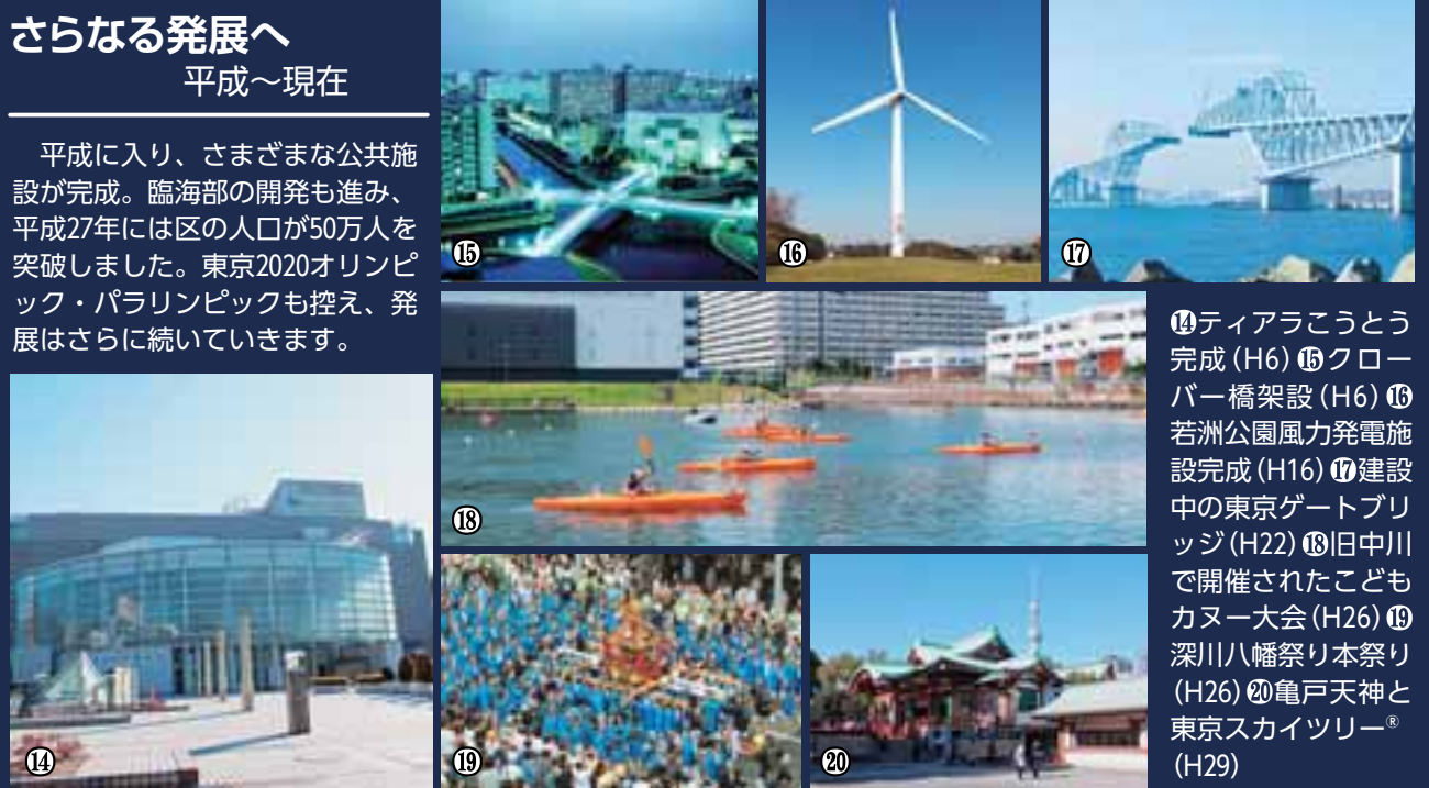
⑭ティアラこうとう完成(H6) ⑮クローバー橋架設(H6) ⑯若洲公園風力発電施設完成(H16) ⑰建設中の東京ゲートブリッジ(H22) ⑱旧中川で開催されたこどもカヌー大会(H26) ⑲深川八幡祭り本祭り(H26) ⑳亀戸天神と東京スカイツリー®(H29)

平成に入り、さまざまな公共施設が完成。臨海部の開発も進み、平成27年には区の人口が50万人を突破しました。東京2020オリンピック・パラリンピックも控え、発展はさらに続いています。