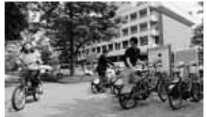
▲ポートも増え、より便利になったコミュニティサイクル

防犯対策は、街頭防犯カメラの設置推進や、防犯パトロール資機材の支給、リーダー研修会の実施などにより、犯罪の抑止および地域の防犯力向上を図るとともに「こうとう安全安心メール」でのタイムリーな情報発信に努めるなど、行政・警察・地域が連携した取り組みをさらに推進してまいります。