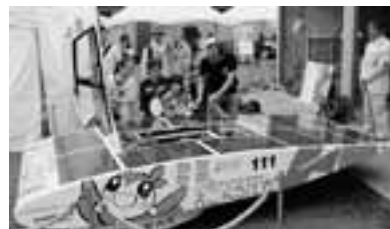
▲昨年の環境フェアの様子

また、羽田空港の機能強化に伴う新飛行経路については、引き続き国への要請を続けていきます。