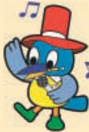
▲江東区民まつり マスコット コトットちゃん