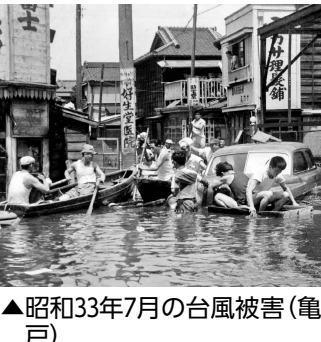
▲昭和33年7月の台風被害(亀戸)

江東区の水害等の歴史を貴重な写真等で振り返るとともに、未来へ向け水辺に親しむまちづくりを紹介する展示会「まちの記憶と未来展」を開催します。