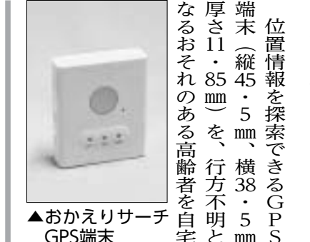
▲おかえりサーチGPS端末