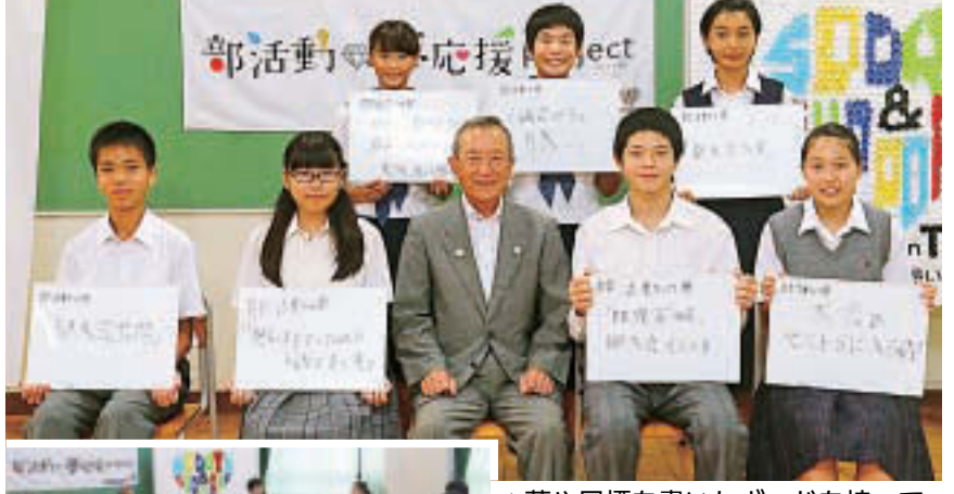
▲夢や目標を書いたボードを持って区長と記念撮影 ▲部活動に励んでいる7人の生徒が深川七中に集まりました