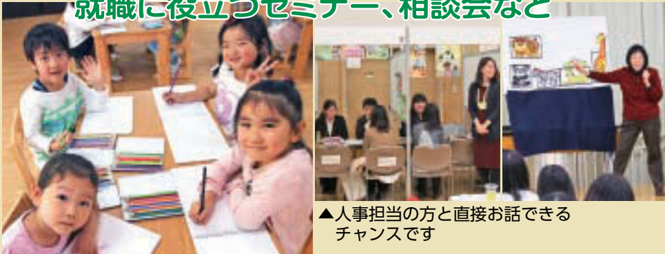
▲人事担当の方と直接お話できるチャンスです

保育の仕事に関心のある方や、保育園に就職を考えている方を対象に、セミナーや区内保育施設運営事業者との面接会を実施します(服装自由・履歴書不要)。また、本フェアを通して就職が決まった方には、就職祝いとして区内共通商品券を贈呈します。