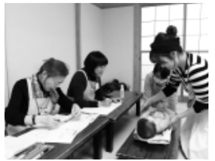
▲子育ての催しもお手伝い

区内では5月21日(日)に行われる「江東こどもまつり」に参加します。100周年用の「とびガエル」の工作で、皆さんと楽しく交流します。