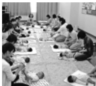
▲乳幼児・保護者も行事に参加(ベビーマッサージ)

各館の催し等の情報は、ホームページでご覧になれます。 子育てひろば 乳幼児とその保護者を対象に、親子のふれあいや友達づくり、情報交換の場として「子育てひろば事業」を全館で実施しています。体操や季節行事等を取り入れて、みんなで楽しく子育て