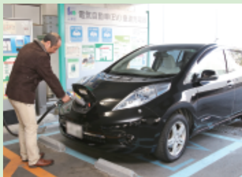
▲充電中の電気自動車(区役所駐車場)

区では、個人住宅・集合住宅および事業所を対象に、地球温暖化の防止に貢献するCO 2 削減効果の大きい、創エネ・省エネ設備の設置について、経費の一部を助成しています。今年度から、次世代自動車(電気自動車・プラグインハイブリッド自動車・燃料電池自動車)と蓄電池を、助成対象に追加しました。対象設備・助成額は、下表のとおりです。省エネ機器等の助成金申請は必ず工事着工前に行ってください※着工後の申請は受付できませんのでご注意ください(次世代自動車のみ事後申請)。また、助成要件・助成金額、申請に必要な書類等の詳細は、区ホームページをご覧ください。☎ 温暖化対策課環境調整係 ☎3647-6124、FAX5617-5737