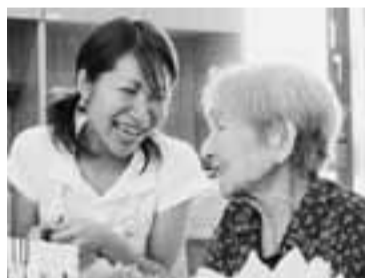
▲介護業界へ、一歩踏み出してみませんか

【株】日本教育クリエイティブ三幸福祉カレッジ錦糸町教室(墨田区錦糸2-15-11) 【入】介護事業所への就業に興味や関心のある方20人(申込順) 【費】無料(会場・見学施設までの交通費は自己負担) 【内】介護の基礎知識(介護業界の現状等)、介護技術のデモンストラーション(移動介助等)、施設見学会、キャリアコンサルティングによる個別相談など 【時】1月13日(金)午後7時半 ※定員になりしだい終了