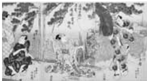
▲「木場 白猿の居宅に遊ぶ図」歌川国貞画(教育委員会蔵)

★:視覚障害者のためのFM放送による音声ガイド付き上映。貸出ラジオは要予約 ※平成29年1/7(土)15:10〜自主制作短編映画上映(入場無料)