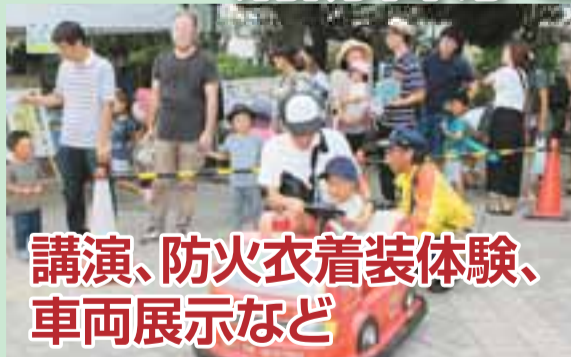
▲ミニ消防車(昨年の消防ふれあい広場)