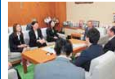
▲笑顔で出場を報告