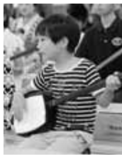
▲気軽にチャレンジ