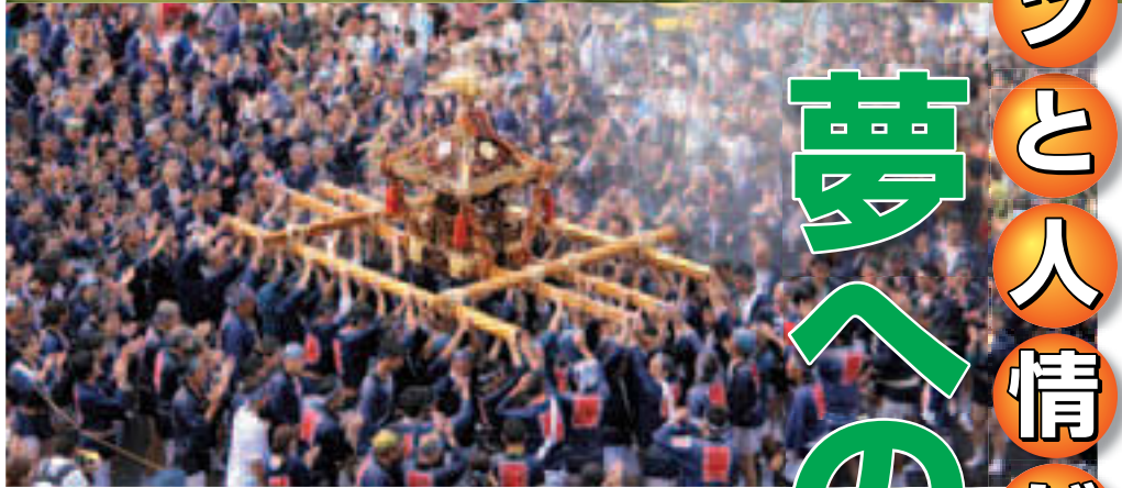
▲2020年に向け加速、魅力いっぱい活気あふれるまちへ

平成28年度の江東区当初予算案は、一般会計で1,886億3,800万円と前年度に比べ6.7%増となりました。また、一般会計と特別会計(国民健康保険会計、介護保険会計、後期高齢者医療会計)を合わせた予算総額は、前年度比4.1%増の2,897億4,100万円となっています。平成28年度当初予算は、2月24日から始まった平成28年第1回区議会定例会の審議を経て、決定します(2面に主な事業)。