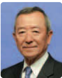
江東区長 山崎孝明

「SPORTS & SUPPORTS KOTO City in TOKYO」スポーツと人情が熱いまち「江東区」これが今年から本格的に本区の魅力を発信するブランドコンセプト