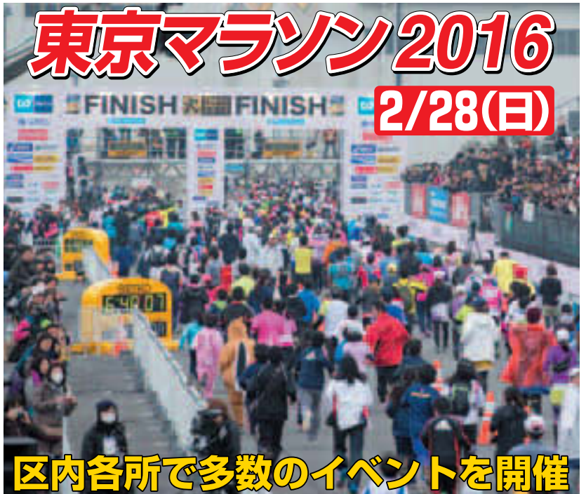
▲フィニッシュ地点の様子(昨年の大会)