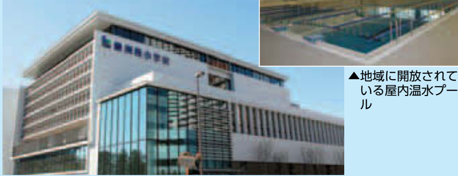
▲地域に開放されている屋内温水プール