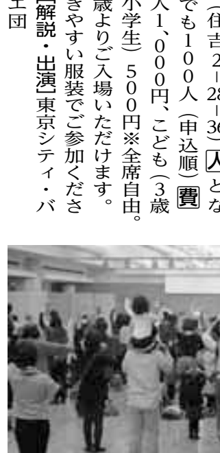
▲親子で一緒にバレエ

「バレエはちよつと敷居が高い気がして…」というバレエ初心者・初体験のパパ・ママ大歓迎! あつと驚く近さで観るダンサーの踊りは迫力満点。素敵なバレエの魅力をご家族でお楽しみください。