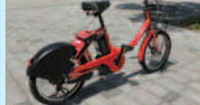
▲電動アシスト付自転車