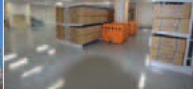
▲救援物資を保管します ◀区外からの救援物資受け入れ施設としてのターミナル型防災倉庫

8月末、区内防災倉庫のターミナル機能を担う中央防災倉庫が竣工し、11月から運用を開始しました。食糧等の応急物資や、災害復旧資機材の保管だけでなく、本区が被災した時に、他自治体からの支援物資(主に水・食料等)の物資輸送拠点としての機能を持っています。直接トラックからの荷さばきが行えるほか、パレット積みができるフォークリフト等を備え、災害時の効率的な支援物資の輸送を可能にします。