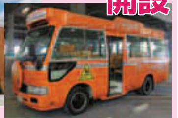
▲本園と分園をバスで結びます

4月、2園目の江東湾岸サテライト保育所が開設されました。保護者の利便性に配慮し、東雲地域住民の利用者が多いイオン東雲店敷地内に分園、少し離れた有明に本園、そして分園と本園間を結ぶ園児送迎バスを運行し、その全てを同一の保育事業者が一体的な運営を行うことで、一貫した保育サービスの提供ができます。今後も地域における保育需要に即した保育所整備を進め、保育待機児童ゼロを目指します。