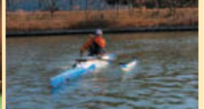
▲さらなる高みを目指し練習します