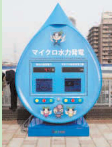
▲マイクロ水力発電の表示モニター

3/18、若洲風力発電施設に続く区の新たな再生可能エネルギーのシンボルとして、横十間川親水公園水門橋に23区で初めてのマイクロ水力発電施設を整備しました。身近で発電の様子を見られる環境学習施設として、また、「水彩都市・江東」を象徴する観光資源として活用します。そのほか、4月には、区役所で使用する公用車として、走行時に水しか出さないエコな燃料電池車「MIRAI」を導入するなど、区は環境に配慮した施策を進めています。