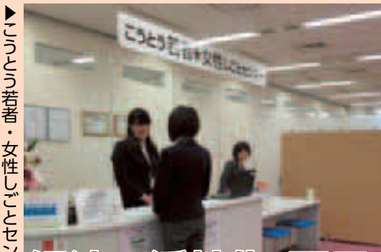
▼「こうとう若者・女性しごとセンター」

3/18、若洲風力発電施設に続く区の新たな再生可能エネルギーのシンボルとして、横十間川親水公園水門橋に23区で初めてのマイクロ水力発電施設を整備しました。身近で発電の様子を見られる環境学習施設として、また、「水彩都市・江東」を象徴する観光資源として活用します。そのほか、4月には、区役所で使用する公用車として、走行時に水しか出さないエコな燃料電池車「MIRAI」を導入するなど、区は環境に配慮した施策を進めています。