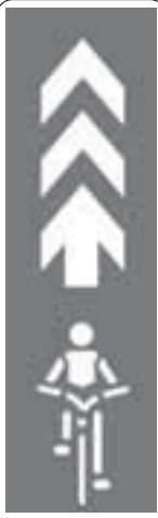
▲亀戸駅周辺に設置されるナビマーク

交通ルールを守り、十分注意して通行しましょう。 ○城東警察署交通規制係 ☎(3699)0110 交通対策課係 ☎(3647)4784