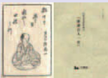
▲「殺生と思はぬ顔や田螺とり」芦月庵為山

「俳諧百人一首」は、「天保の三大家」と称された田川(自然堂)鳳朗を筆頭に、蓬窓風外、芦月庵為山、梅雪庵梅笠など、江戸時代後期に活躍した百名の俳人たちの一句に、彼らの画像を添えたものです。画像と句をお手にとってお楽しみください(費)800円(税込)