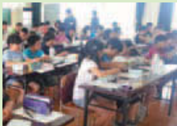
▲温暖化について学ぶ水神小のこどもたち

区では、「カーボンマイナスこどもアクション」について出前講座を行いました。今年度は第二亀戸小、八名川小、水神小の5年生、第三砂町小の5・6年生が、地球温暖化とエネルギーについて学びました。東京ガス(株)と協働し、燃料電池を使った実験を盛り込み、興味を持ったこどもたちは熱心に実験に取り組んでいました。