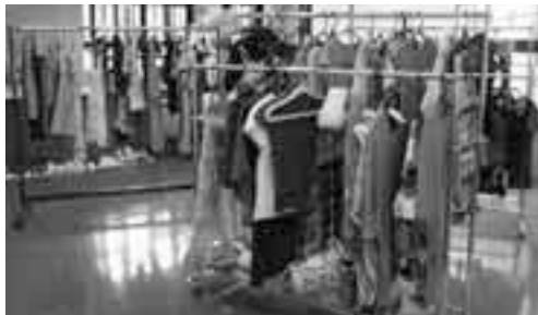
▲着なくなった服等を譲り、新たなお気に入りに見つけましょう

クローゼットに眠るオシャレな洋服を誰かと交換しませんか? まだきれいなのに、着なくなってしまった洋服等を持ち寄り、交換しあうイベント「カニビアーレ」を開催します。