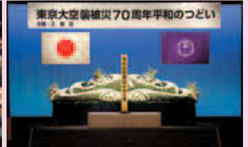
▲平和のつどいでは、東京大空襲の犠牲者を追悼しました