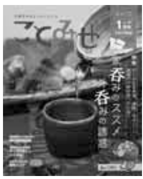
▲ことみせ1月号表紙

特集では老舗酒屋やおつまみも魅力的な酒場からの酒ばなしも。また、砂町エリアのクーポン付お店情報を紹介。