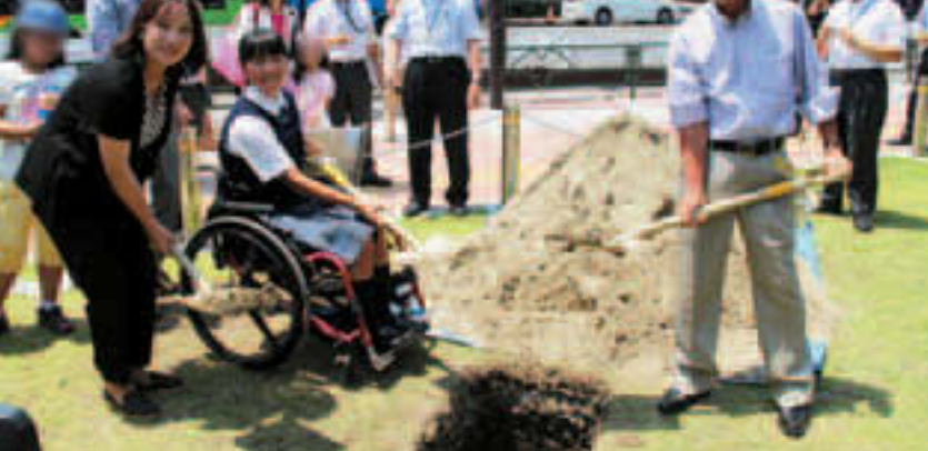
▲5年前イベントには、女子バレーボールオリンピックの竹下佳江さん(左)も参加

2020年東京オリンピック・パラリンピックでは、江東区内に全区市町村で最多となる9競技9会場(オリンピック)、7競技6会場(パラリンピック)が配置されます(12/10現在)。江東区では、本大会の開催を契機として、新たなレガシーを創造し、区が持続的に発展していくため、「江東区オリンピック・パラリンピックまちづくり基本計画」を策定しました。7/24には大会5年前イベントとして「聞かせて!あなたのオリンピック・パラリンピックこども編」を開催。こどもたちが大会に向けた夢を発表し、タイムカプセルに詰めました。