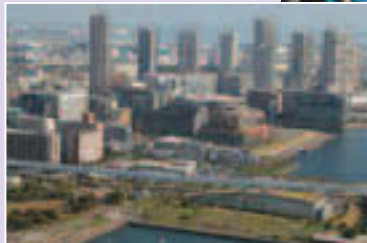
▲未来を担う元気いっぱいのこどもたち

6/12、江東区の人口が50万人を突破しました。昭和22年に江東区が発足して以来、昭和32年に30万人、平成14年に40万人を突破し、その後も南部地域の開発などに伴い人口は伸び続け、ついに50万人に達しました。人口50万人突破を記念し、6/12に区役所に出生届を出した区民の方に認定証や区の観光キャラクター・コトミちゃんのぬいぐるみなどのお祝いの品を贈りました。なお、本年3月に策定した長期計画(後期)では、目標年次の平成31年の人口をおおむね52万人と推計しており、今後も区の人口は増加し続ける見込みです。