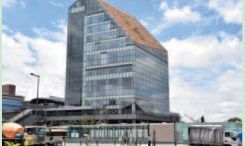
▲区南部地域の拠点として、多くの区民が集い、憩える施設です

9/24、区南部地域の急激な人口増加に対応するため、豊洲駅前に整備を進めてきた豊洲シビックセンターがオープンしました。発展が続く区南部地域における新たな拠点施設として、特別出張所、文化センター、図書館等の機能を備えた複合施設です。建物周囲や壁面だけでなく、8階から12階にかけて階段状に樹木を植え、里山をイメージした豊かな緑化空間を設けています。また4月には、豊洲駅前交通広場の地下に、人口増加に伴う自転車需要に対応するため、新たな自転車駐車をオープンしました。