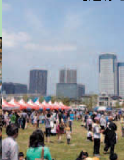
▲湾岸エリアのにぎわい