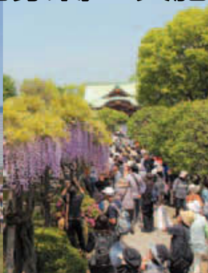
▲亀戸天神藤まつり