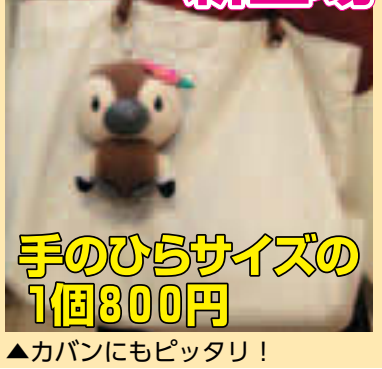
▲カバンにもピッタリ!

江東区観光キャラクターコトミちゃんのマスコットができました。大きさはちょうど手のひらサイズ。ボールチェーンがついているので、カバンにぶら下げて一緒にお出かけしてね。 【価格(税込)】1個800円 【販売場所】区内各文化センター、ティアラこうとう、深川東京モダン館、深川江戸資料館、中川船番所資料館、芭蕉記念館、江東区観光協会(東陽4-5-18産業会館内) ☎江東区観光協会 ☎6458-7400