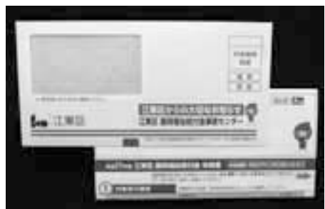
▲申請書が入った封筒

臨時福祉給付金は、申請から振込みまでに1、2か月ほどかかります。※申請された方の中で、審査にお時間がかかる方もいます。また、申請が短期間に集中した場合は、さらにお時間をいただく場合がありますので、あらかじめご了承ください。