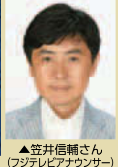
▲笠井信輔さん(フジテレビアナウンサー)

▲ミニ消防車乗車体験、煙体験の避難訓練もあります 暖房器具を使用するなど火災が発生しやすい時期を迎え、消防署ではイベントを実施します。防火防災に対する意識や行動力を高めましょう。 消防ふれあい広場 時 11/8(日)10:00~16:00 場 南砂町ショッピングセンターSUNAMO(新砂3-4-31) 内 各種体験(ミニ消防車乗車・ミニ防火衣装着・スタンドパイプの消火※雨天中止あり)、煙体験の避難訓練など 申 当日直接会場へ 問 城東消防署 ☎3637-0119 防火のつどい 時 11/10(火)13:30~16:30 場 江東区文化センターホール(東陽4-11-3) 内 [第1部]火災予防に貢献した地域の方々の表彰式 [第2部] 笠井信輔さん(フジテレビアナウンサー)の講演会「震災報道の裏側~人として、報道人として~」 申 当日直接会場へ 問 深川消防署 ☎3642-0119 庁舎開放(深川消防署) 時 11/15(日)10:00~14:00 場 深川消防署(木場3-18-10) 内 放水訓練、消火器訓練、はしご車搭乗体験(9:50~受付、30組60人(先着順)※雨天中止)など 申 当日直接会場へ 問 深川消防署 ☎3642-0119