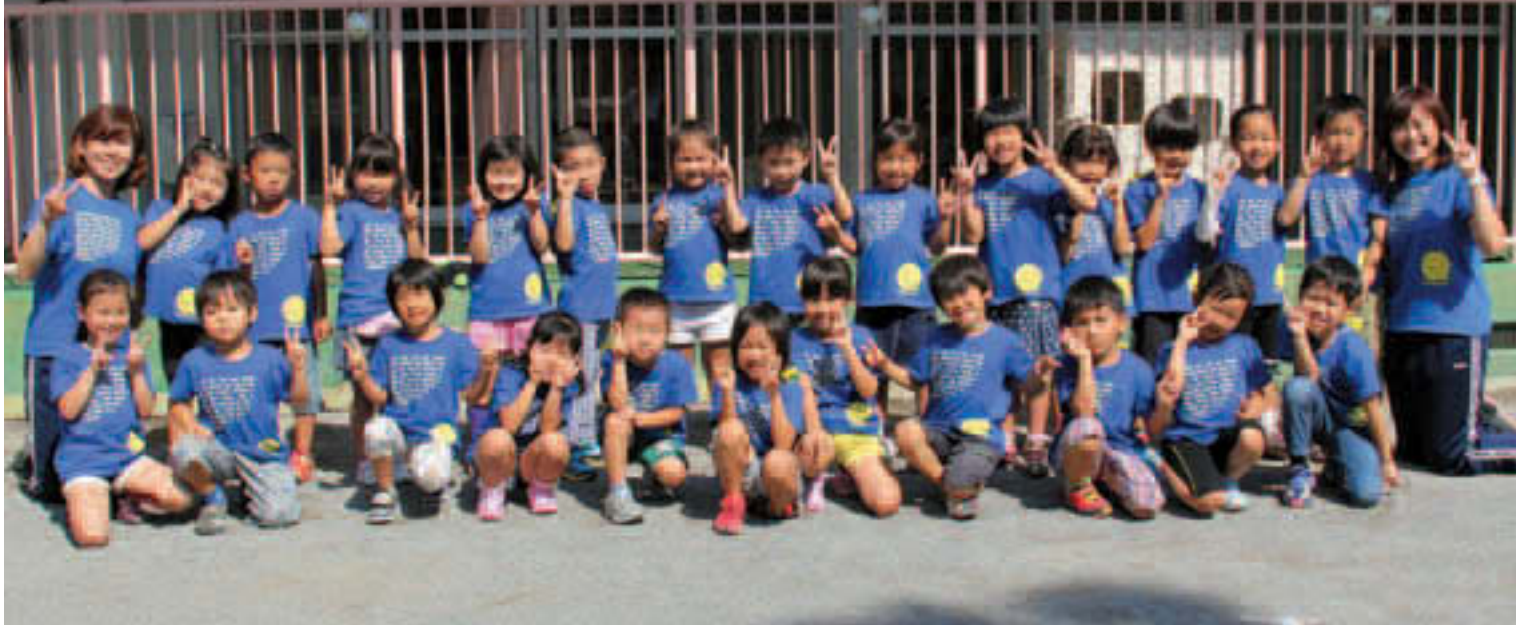
▲みんなで仲良く元気に！(写真は小名木川第二保育園)

認可保育園・認定こども園(2・3号認定)・小規模認可保育園 豊洲シビックセンターに4月入園受付窓口を臨時開設