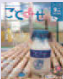
▲買い物・食事等に役立つ情報誌

大島・住吉エリアのクーポン付お店情報のほか、「区内銭湯でひとつ風呂!」ゆったりと湯が楽しめるお風呂屋さんを紹介。また、生鮮三品もそろそろ地域の台所「大島中の橋商店街」の情報も発信しています。 [冊子配布場所] 区役所、各出張所、区内都営地下鉄7駅パンフレットラック等 関 経済課商業振興係 ☎3647-9502、ことみせ事務局 ☎5628-0573 HP http://kotomise.jp/