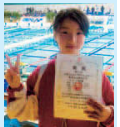
▲将来の夢は東京オリンピックに出場すること

姉兄の影響もあり2歳から水泳を始め、保育園のころには4泳法をマスターしていた茜里さん。同じスポーツクラブに通う4人でチームを組み、フリー(自由形)リレー種目で標準タイムを突破し、全国大会に出場。慎重かつ大胆な引継ぎを心がけ、見事7位に入賞しました。「4人の絆が繋がって、この結果が出せました。支えてくれたコーチや家族に感謝したいです。」と語ってくれました。「個人種目のタイムを上げて、またあの大舞台に立ちたい。」と、次の目標に向かって週5日の厳しい練習に取り組んでいます。