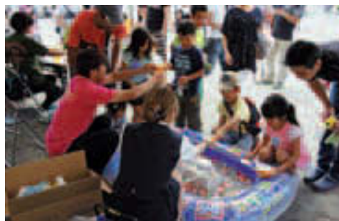
▲スーパーボールすくい(子ども広場)

時 9/26(土)13:30~15:30(12:30から受付) 場 有明スポーツセンター 入 [3~4歳クラス]親子20組(抽選) [5~6歳クラス(未就学児)]20人(抽選) [小学1~3年生クラス]20人(抽選) ※いずれのクラスも保護者2人まで同伴可 費 1,000円(当日受付で支払) 締 9/13(日)必着 申 往復はがきに①クラス名②住所③電話番号④参加者氏名(ふりがな)⑤生年月日⑥保護者氏名を記入し、〒135-0063有明2-3-5有明スポーツセンターへ ☎3528-0191