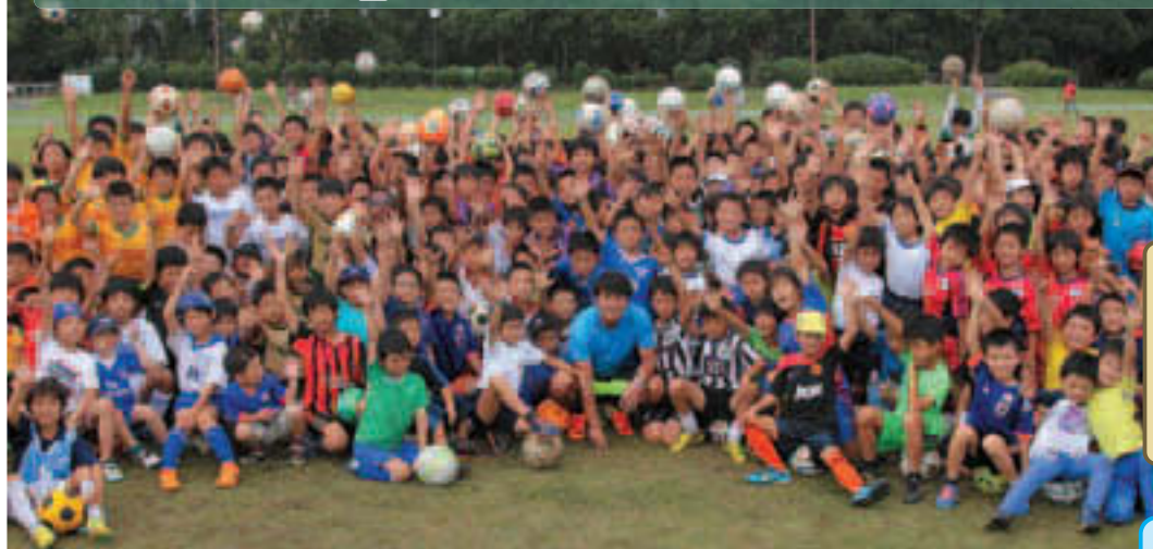
▲みんなで楽しくサッカー!(写真は昨年の様子)

サッカー、キャッチボールなどの身近なスポーツをはじめ、マット運動やパラリンピック種目のブラインドサッカー、ポッチャなど、さまざまなスポーツが体験できるイベントです。各会場で自由に好きなスポーツに挑戦できるほか、トップアスリートによるパフォーマンスもあります。友達同士、親子で、ぜひお越しください。イベントの詳細は区ホームページでご覧になれます 場 区立夢の島競技場(夢の島1-1-2)、都立夢の島公園陸上競技場(夢の島2-1-2) 人 小学1～6年生[主催]江東区・江東区教育委員会[後援]東京都[協力]日本体育大学・順天堂大学・(公社)東京都障害者スポーツ協会・日本ダブルダッチ協会・NPO法人日本ジュニアゴルファー育成協議会・江東区スポーツ推進委員会 問 スポーツ振興課 ☎3647-4887