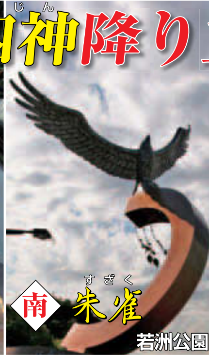
南 すざく 朱雀