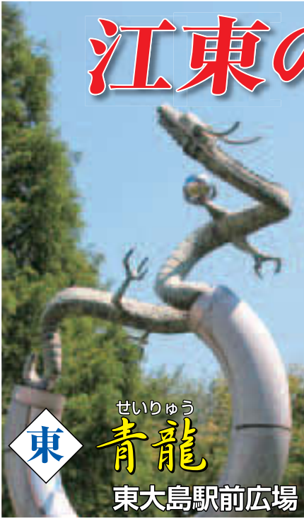
東 せいりゅう 青龍