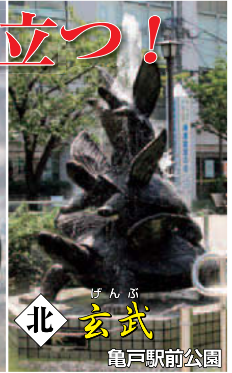
北 げんぶ 玄武