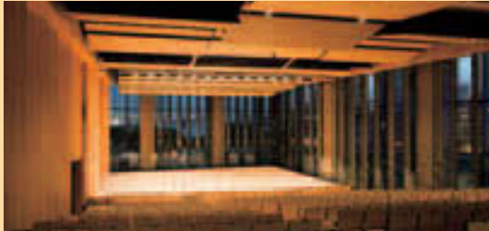
▲レインボーブリッジも見えるホール

1階ギャラリーのほか、音楽練習室、レクホール、サブ・レクホール、研修室8室、和室、茶室など多種多様な施設を備え、利用者の需要に応えます。5階の300席のホールには、外が見える開閉パネルが備えられ、景色を見ながら音楽などを楽しむ演出もできます。また、常設されるピアノ「FÁZÍÓLI」は都内の文化施設では唯一のもので、☎ 豊洲文化センター ☎3536-5061(9/14(月)までは移転作業のため、つながりません)