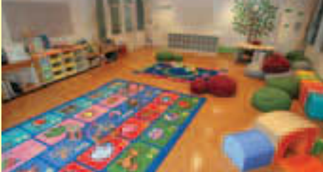
◀おはなしのへやキッズ