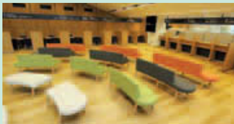
▲広々とした待合スペース

名称を「豊洲出張所」から「豊洲特別出張所」と変更し、これまでの機能に加え、新たに戸籍の届出の受付や子育て支援関係の業務も行います(詳細3面)。また、区役所本庁舎と同様、毎週水曜は19:00まで開庁時間を延長するとともに、毎月第3日曜(3月は第4日曜)に日曜窓口を開設し、利便性を高めます。入園相談は平日のみ17:00までです。なお、豊洲区民館は廃止となります。 ☎ 豊洲出張所 ☎3531-6316