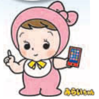
国勢調査イメージキャラクター