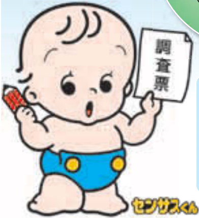
国勢調査イメージキャラクター