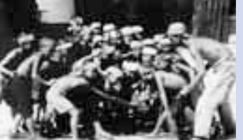
▲当時の写真(上)や父から子への手紙(左)などを収蔵