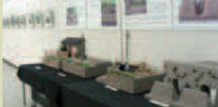
▲昨年のパネル展の様子

東京大空襲の写真、学童集団疎開をした子どもたちの写真などを展示します 時 8/12(水)～18(火) 9:00～21:00(最終日は13:00まで) 場 江東区文化センター2階展示ロビー(東陽4-11-3) 費 無料 申 当日直接会場へ 問 総務課総務係