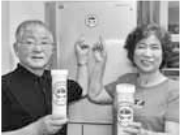
▲冷蔵庫に収納!ご夫婦なら各1個配付