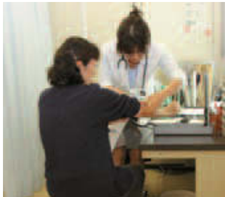
▲健(検)診の通知等に使用します

今回のご意見を踏まえて必要な見直しを行い、有識者による第三者点検を経て、平成27年8月末までに特定個人情報保護委員会へ評価書を提出し、公表を行う予定です。(すでに公表している他の事務の評価書は、区ホームページまたはこうとう情報ステーションで閲覧できます)