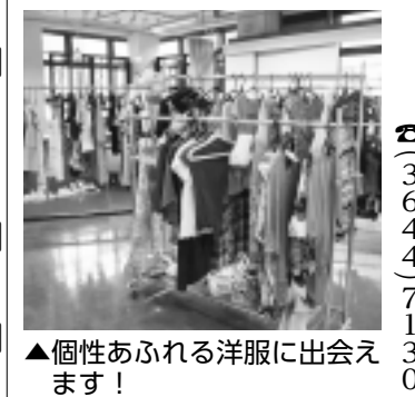
▲個性あふれる洋服に出会えます!

地域で見守り支え合おう 「孤独死」「社会的孤立」にならないよう、地域が見えてくる支援プログラム「ひとり暮らしの高齢者の方が自宅で亡くなり長期間気づかれなない「孤独死」や親族・地域との関わりを持たない「社会的孤立」状態にならないよう、福祉協議会では「高齢者地域見守り支援事業」を実施し、サポート地域の皆さんとともにさまざまな取り組みを行っています そのひとつとして、地域に住む人々のつながりを再確認し、地域力アップを図るためのセミナーを開催します。 誰もが気軽に見守り助け合い、安心して暮らせる地域をつくるにはどうしたらよいか、「支え