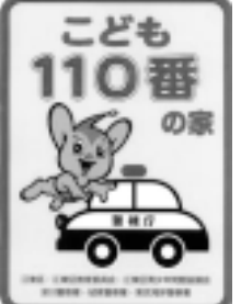
▲「子ども110番の家」のステッカー

夏休み期間中は、帰省、旅行などで自宅を空ける機会も増え、会社やお店なども長期閉休みとなるため、空き巣や事務所荒らしなどの泥棒被害が増える傾向にあります。 空き巣の侵入手段は、住宅の種類に応じて違っており、二戸建て住宅では「ガラス破り」が中・高層住宅では施錠されていないドアなどからの侵入が多くあります。次のような対策を講じましょう。