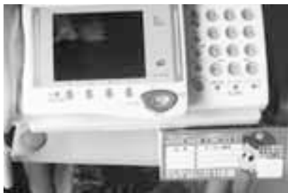
▲三角POPを電話のそばに置いて振り込め詐欺を防止!