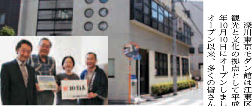
▲10万人目のご夫妻を中央に記念撮影

深川東京モダン館は江東区の観光と文化の拠点として平成21年10月10日にオープンしました。オープン以来、多くの皆さんにご来館いただき、5月1日に来館者数10万人を超えました。記念すべき10万人目の来館者は富岡からお越しのご夫妻で、当日は深川東京モダン館の石島館長から江東区の魅力が詰まった記念品の贈呈が行われました。これからも深川東京モダン館は区内外からの方へ何度も足を運んでもらえるような魅力的な施設を目指します。おきがる講座や昔遊び、落語寄席、企画展などたくさん催しものを用意して、皆さんのご来館をお待ちしています。 問 深川東京モダン館(門前仲町1-19-15) ☎(5639)1776 HP http://www.fukagawa-tokyo.com/