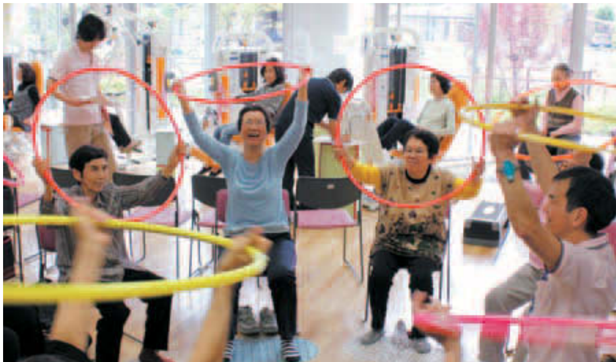
▲元気なうちから身近な場所で介護予防(大島7丁目「あかつき苑」の健康増進スペース)