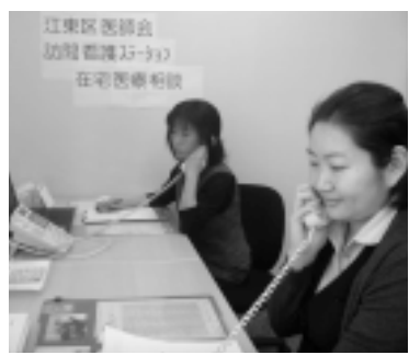
▲専門のスタッフが相談に応じます

病院から自宅に退院する時や療養生活に不安がある時などに、安心して在宅医療を受けられるように相談窓口を開設します。 時 6月1日(月)から 内 在宅医療に関する相談(高齢者の介護等に関する相談は長寿サポートセンターへ) 相談窓口 江東区医師会訪問看護ステーション ☎(3646)5500