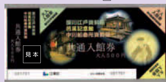
▲「江東区歴史三館共通入館券」

割引き共通券を区内各文化センターなどでも販売 深川江戸資料館・芭蕉記念館・中川 船番所資料館の三館を割引料金で見学 できるお得な共通券を、区内文化セン ターなどの窓口で販売します 費 大人 500円(通常800円)、小・中学生100円(通 常150円) [販売場所] 区内各文化セン ター、総合区民センター、ティアラこ とう、深川江戸資料館、芭蕉記念館、 中川船番所資料館 [有効期 間] 最初の利用日から1年間 有効(本券で1館につき1回 見学できます) 問 深川江 戸資料館☎3630-8625、芭 蕉記念館☎3631-1448、中 川船番所資料館☎3636- 9091