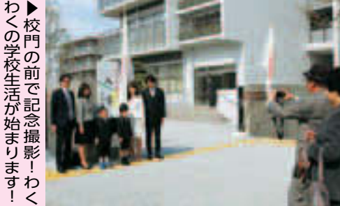
▶校門の前で記念撮影! わくわくの学校生活が始まります!