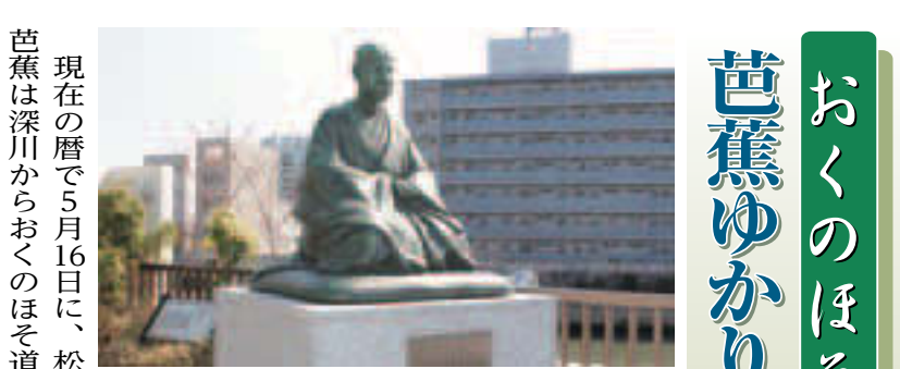
▲芭蕉庵史跡展望庭園にある芭蕉像

現在の暦で5月16日に、松尾 芭蕉は深川からおくのほそ道の 旅に出立しました。これを記念 し、まちあるきイベントを行 います。専門家による講演会や、 船中で参加者に俳句を詠んでも らうイベント等も行います。 時 内 下表のとおり 縮 5月9日(土) 必着 申 4月25日(土) からファク スに①名前②住所③電話番号④ 生年月日(保険加入手続きに使 用)⑤参加希望日(17日はコー ス番号記載)を記入し、NPO 法人本所深川事務局へ ☎090(2206)0240 FAX(3642)4127