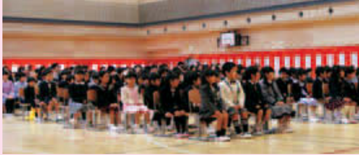
▲緊張した面持ちで入学式に臨む新入生