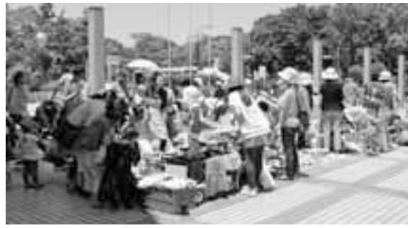
▲大勢の人でにぎわうフリーマーケット(昨年の様子)

フリーマーケット・小学生テニス教室 リサイクルフリーマーケット (子ども用品) 出店者募集 時 5月17日(日) 午前10時半 ～午後3時半 場 ティアラこうとう入口前オ ーンスペース(住吉2-28- 36)等(小雨決行) 「出店資格」区内在住の18歳以上 の方(親子の参加歓迎)、午前 10時集合～午後3時半まで出店 可能な方、22店舗(抽選)、業者 の申込は無効 「区画」スペース約1坪※駐車 場はありません。 費 1店舗500円 締 4月3日(金) 消印有効 申 往復はがきに住所・氏名・ 年齢・電話番号・出品目(こ ども対象の品物のみ。ただし動 植物・食品・危険物等は除く。 売値は500円を上限とする) を記入し、〒135-8383区役所放課 後支援課内「江東子どもまつり 実行委員会事務局フリーマーケ ット担当」へ 環 環境整備推進委員会(老 沼) ☎・FAX(3645)7581 小学生テニス教室 参加者募集 時 5月17日(日) ①午前10時 半～②午後1時半(各回2時 間) 場 都立猿江恩賜公園テニス場 (毛利2-13-7) 人 区内在住・在学の小学生、 午前・午後各50人(抽選) 費 無料 内 江東区テニス連盟が指導す る教室です。経験の有無等によ りクラス編成し、初心者にはや わらかめのボールを使用します。 ラケットをお持ちの方は持参し てください。(天候により一部 変更する場合あり) 締 4月3日(金) 消印有効 申 往復はがき(1人1枚・1 コースのみ)に希望コース(① 午前・②午後・③どちらでも) と参加者名(ふりがな)・性別・ 学年(4月時点での)・住所・電 話番号・経験の有無(有の場合 は年数)・ラケットの有無を記 入し、〒135-8383区役所放課後支 援課内「江東子どもまつり実行 委員会事務局」へ 放 放課後支援課育成係 ☎(3647)9230 ☎(3647)9274 FAX(3647)9274