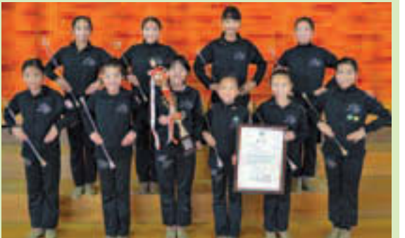
▲区立小学校に通う10人の精鋭たち!

1チーム15人の内、10人が豊洲小、豊洲北小、枝川小、辰巳第二小に通う小学生で構成されるLILYバトンスタジオは、各地区予選を勝ち抜いたチームが集まる全国大会(U-12の部は25チームが出場)で、優秀賞を受賞しました。普段は、区内の小学校やスポーツセンターなどで練習をしており、暑い日も寒い日もがんばってレッスンをしてきました。大会では、チームワーク良く元気に息の合った演技を披露。夢だった全国大会に出場できたことに、感激です。今後は、技に磨きをかけ、新しい技にも挑戦し、全国大会でさらに上位の入賞を目指します!