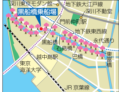
船上から鮮やかな桜を堪能できます▶