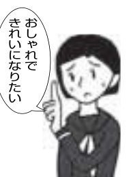
おしゃれで きれいになりたい