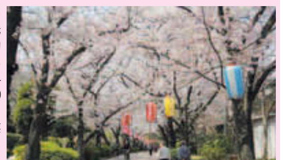
文化観光ガイドがご案内 ▲南砂緑道公園の桜並木

江東区の史跡とともに楽しめるおすすめの桜並木を文化観光ガイドがご案内します。全国的に有名な砂町銀座商店街で買い物も楽しめます【時】4/1(水)～4(土)※少雨決行【出発】①10:00②13:00(いずれも2時間半程度)【集】出発時間10分前までに産業会館2階ロビー(東陽4-5-18)【人】2時間半程度のまちあるきができる方、各回25人(申込順、小学生以下は要保護者同伴)【費】500円(保険代ほか※小学生以下は無料)【主な見所】南砂緑道公園の桜並木(長州藩大砲製造所跡・汽車製造会社跡・城東鉄道軌道跡)～弾正橋～仙台堀川公園の桜並木(砂町運河跡・旧大石家住宅)～砂町銀座商店街(砂町文化センター解散※買い物はツアー解散後に各自)【問】3/16(月)9:00から電話で江東区文化観光ガイド事務局(産業会館内)☎6458-7410