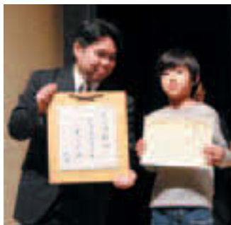
▲句の書かれた色紙も贈呈

2月21日、江東区立小・中学校俳句大会「きらり☆こうとう俳句祭」が江東区文化センターで行われました。区では、俳句と縁の深い地域特性を生かして今年度から俳句教育の推進を強化しており、その成果発表の場として初めて開催されました。第一部では、区立小・中学校の全児童・生徒が作った俳句の中から選ばれた優秀作品の表彰式が行われ、賞状等が手渡され