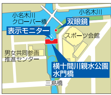
※三島橋工事中のため、一部通行止めがありますのでご注意ください

水力発電は、水の落差(高低差)と水の量を利用して発電するもので、主に山間部に導入されてきましたが、近年の技術開発により落差の少ない都市の低平地でも導入が可能になりました。設置場所は海水に近い塩分濃度であるため、目には見えませんが塩害対策も施しています。 電力は表示モニターや水門橋のライトアップに利用 発電出力は1kW程度で、発電