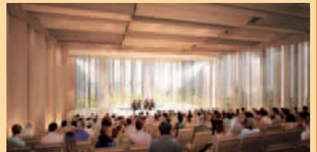
▲外の景色が見える開閉パネルを備えた300席のホール

はインターネットでの利用申込不可。詳細はお問い合わせください 〇 豊洲文化センター ☎3536-5061