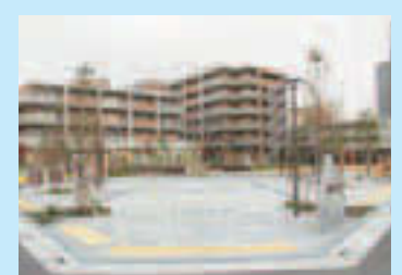
▲地域交流・健康増進スペースなどを含む複合施設です