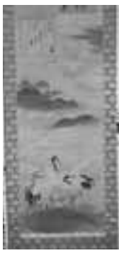
鶴澤探索画松平定信書三幅対(部分)

豊臣秀頼をはじめ、勝海舟、佐久間象山など、文人たちの和歌や俳句の色紙・短冊などが展示されます。特に、鶴澤探索が描いた絵に松平定信が和歌を書いた、三幅対は初公開です。