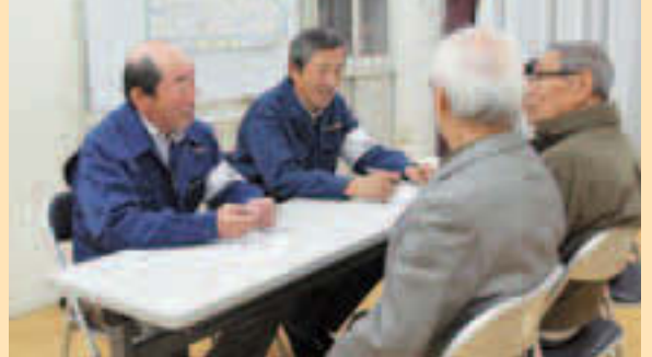
▲地域における防災力の向上を図ります(写真は災害協力隊)

災害が発生した際に自ら避難することが困難な方を掲載した名簿を作成しました。同意方式名簿(名簿の外部提供に同意した方を掲載)を平常時から災害協力隊等の地域団体に提供し、個別の避難支援計画を作成します。名簿を活用し事前に準備することで、実効性のある避難支援体制の確立を目指します。