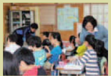
▲学びスタンダード強化講師による、きめ細やかな学習指導

区は、小・中学生に必ず身に付けさせたい内容を「こうとう学びスタンダード」としてまとめ、全校での定着を目指しています。昨年度「学び方・体力・算数」が、今年4月からは「国語・数学・英語」が導入され、全面实施となりました。その確実な定着に向け、「学びスタンダード強化講師」を全小・中学校に配置しています。また、歴史的に俳句と深い縁がある江東区の特徴を生かし、俳句教育の実施を「国語スタンダード」に位置付け、児童・生徒がさまざまな機会に俳句に取り組めるようにしています。