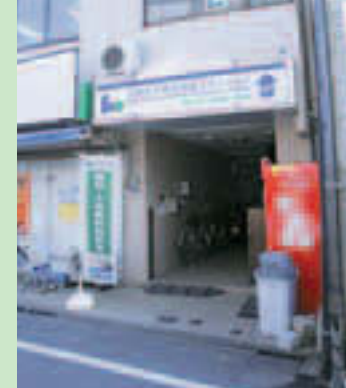
▲不燃化相談ステーション

区は、木造住宅が密集し、災害時に火災延焼等の危険性が高い北砂3～5丁目地区(3丁目の一部、4丁目、5丁目の一部)を不燃化特区として指定し、7月から老朽建築物の建て替えや取り壊し費用の助成などを開始し、「燃えない・燃え広がらないまち」を目指しています。また、相談員が常駐し、建て替えなどに関する問い合わせ等について対応する「不燃化相談ステーション」を地区内に開設しています。