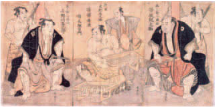
▲「谷風・小野川横綱授与の図」勝川春英画（相撲博物館蔵）

江戸勸進相撲の舞台となった本所深川は、相撲ゆかりの史跡や文化が多数息づいています。展示では、相撲の歴史、勸進相撲の舞台となった富岡八幡宮と両国回向院、数々の名勝負を繰り広げた力士や相撲の風景、深川を中心に地域に残る相撲関連の史跡を紹介し、さまざまな角度から「相撲と本所・深川」の歴史と地域性を探ります。 時 11月11日(火) ~ 平成27年11月8日(日) 午前9時半 ~ 午後5時(最終入館午後4時半) 費 大人400円、小・中学生50円(観覧料※中学生以下は保護者同伴。同伴できない場合は要事前連絡) ㊦ 当日直接会場へ 場 ㊦ 深川江戸資料館(白河1-3-28)